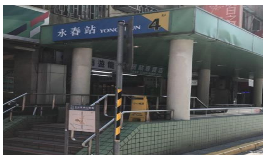
捷運永春站 4 號出口