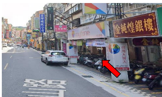
松山路直走途經「台灣大哥大」