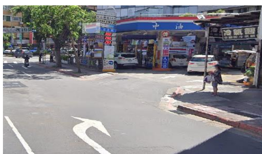
松山路直走途經「台灣中油」