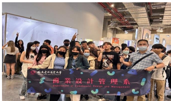
7. 招生活動：(新北市)111 學年度高級中等學校『技職 Chain 跳轉未來』，地點：新北市政府市民廣場，時間：112 年 05 月 27 日